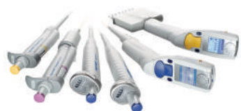
Pipetas manuais e eletrônicas, dispensadores e sistemas automatizados de pipetagem

A Eppendorf é uma empresa líder em ciências da vida que desenvolve e vende equipamentos, consumíveis e serviços para laboratórios.