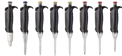
Pipetas mono e multicanaís