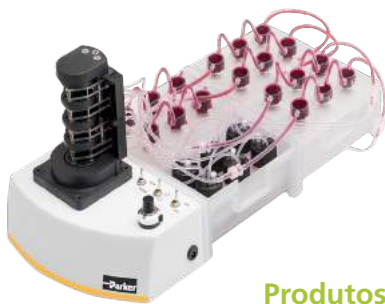
Produtos para cultivo 3D