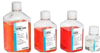
Meios de cultura tradicionais e especiais, reagentes, suplementos e antibióticos