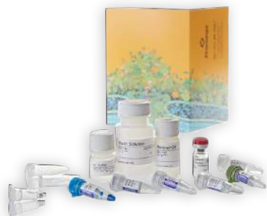
Kits para extração de DNA e RNA

Com um portfólio de mais de 4.000 produtos abrangendo as áreas de genômica, análise e expressão de proteínas, análise celular, descoberta de medicamentos e identidade genética, a Promega é líder global no fornecimento de soluções inovadoras e suporte técnico para cientistas da vida acadêmica, industrial e governamental.