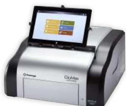
Leitoras de microplacas e luminômetros