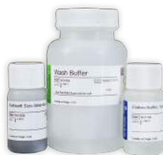
Reagentes e kits para purificação e quantificação de biblioteca NGS