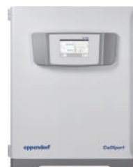
Incubadoras de CO2