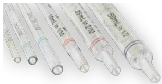
Pipetas sorológicas e de transferência