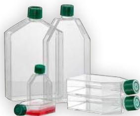
Placas e frascos para cultivo celular, sistemas de filtração e acessórios