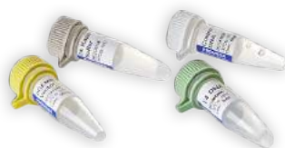
Vetores, kits, células e reagentes para clonagem