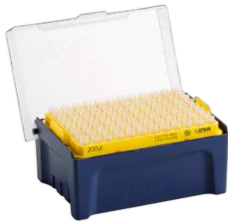
Ponteiras com e sem filtro, ponteiras de baixa retenção e racks

A USA Scientific é fabricante de plásticos de alta qualidade. Oferece equipamentos e acessórios confiáveis que ajudam pesquisadores a realizar o importante trabalho do laboratório.