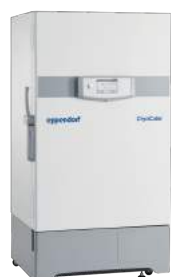
Freezers ultrabaixa temperatura