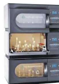
Agitadores e shakers