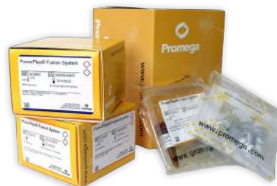
Soluções para identificação genética