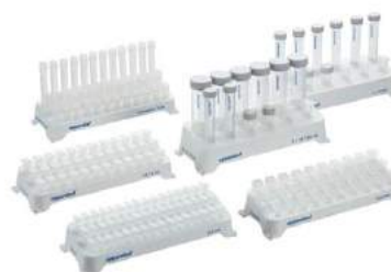
Ponteiras, tubos, placas e consumíveis para cultivo celular