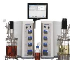
Equipamentos para bioprocesso