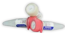
Enzimas de restrição