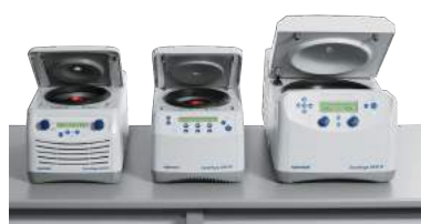
Centrífugas e concentradores