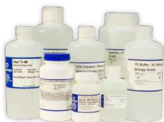
Reagentes, sais, marcadores, tampões e químicos em geral