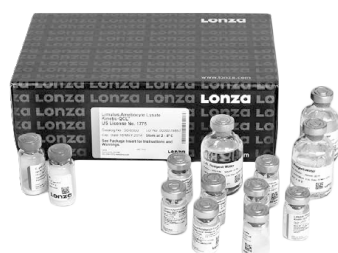
Equipamentos, kits e reagentes para detecção de endotoxinas