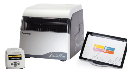
Equipamentos automatizados de extração