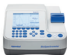
Espectrofotômetros e cubetas para microvolume