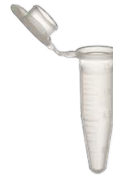
Tubos de diversos volumes e para aplicações variadas, tubos criogênicos e acessórios