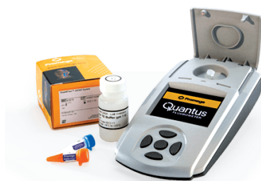
Equipamentos e reagentes para quantificação de DNA e RNA