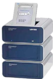
Equipamentos, kits e acessórios para transfecção