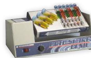
Equipamentos em geral, agitadores, shakers, vórtex e microcentrífugas