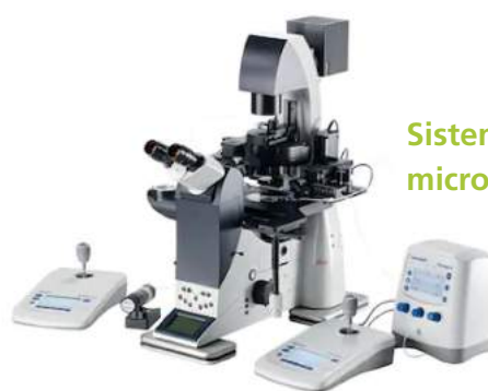
Sistemas de micromanipulação