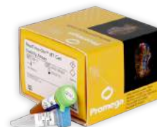
Reagentes e kits para análise celular