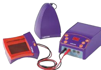
Sistemas, géis, marcadores, tampões e reagentes para eletroforese