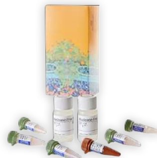
Enzimas, kits, dNTPs e mixes para PCR e qPCR