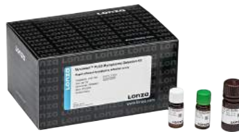
Equipamentos e reagentes para detecção, prevenção e eliminação de micoplasma