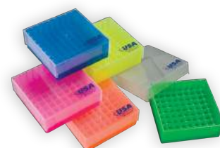
Racks, etiquetas, caixas para armazenamento e racks para freezer