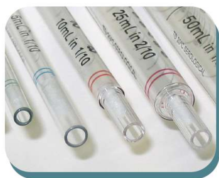
Pipetas sorológicas e de transferência