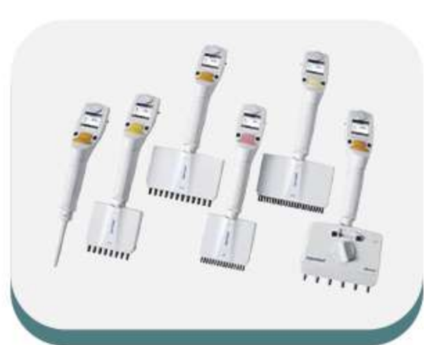
Pipetas manuais e eletrônicas, dispensadores e sistemas automatizados de pipetagem

A Eppendorf é uma empresa líder em ciências da vida que desenvolve e vende equipamentos, consumíveis e serviços para laboratórios.