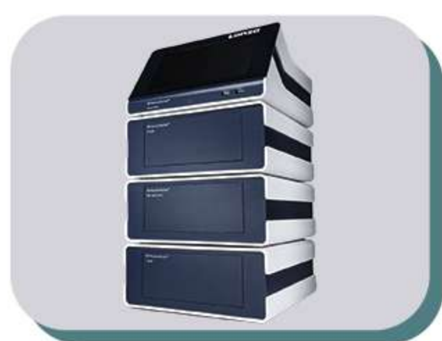
Equipamentos, kits e acessórios para transfecção