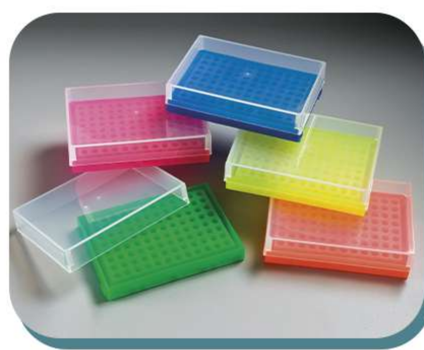
Racks, etiquetas, caixas para armazenamento e racks para freezer