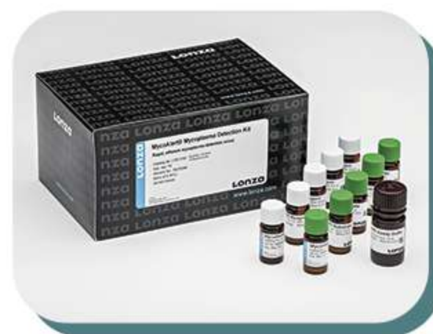
Reagentes para detecção, prevenção e eliminação de micoplasma