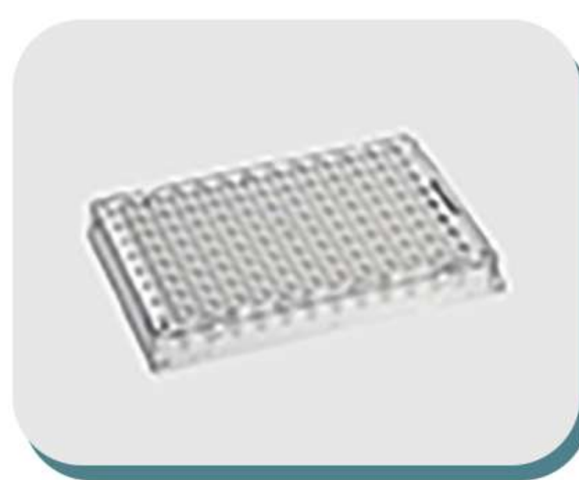
Placas para PCR e qPCR, selantes e acessórios