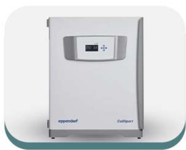
Incubadoras de CO2