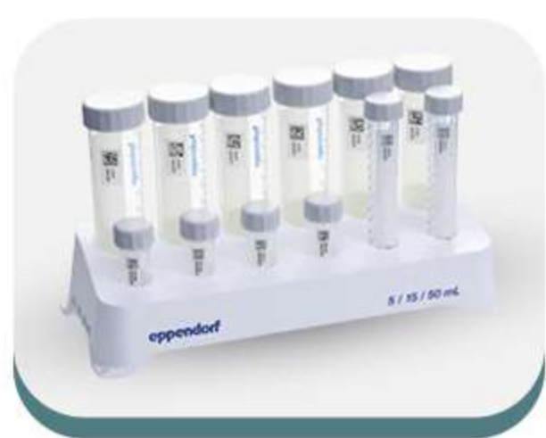
Ponteiras, tubos e placas