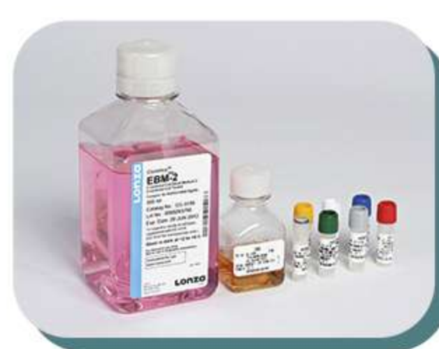
Meios de cultura e suplementos