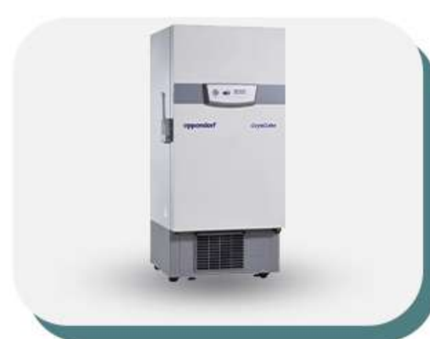
Freezers de temperatura ultrabaixa