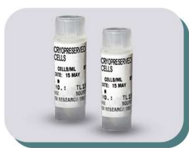
Células primárias e células tronco

A Lonza fornece aos pesquisadores de ciências da vida as ferramentas necessárias para desenvolver e testar terapias, desde a pesquisa básica até o lançamento do produto final.