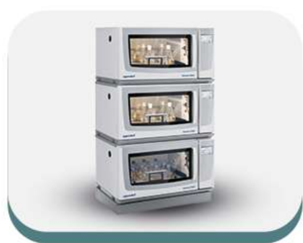
Agitadores e shakers