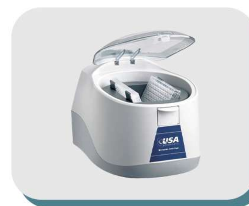
Equipamentos em Geral