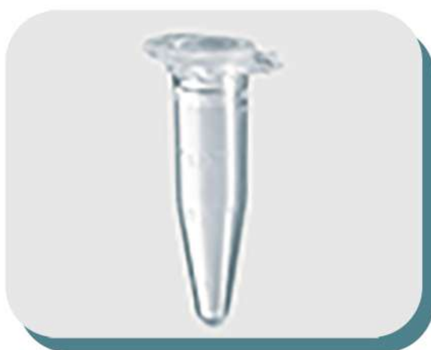
Tubos de diversos volumes e para aplicações variadas, tubos criogênicos e acessórios