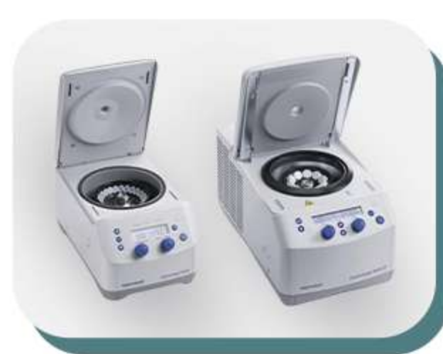
Centífugas e concentradores