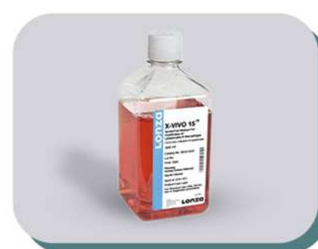
Meios serum free e quimicamente definidos