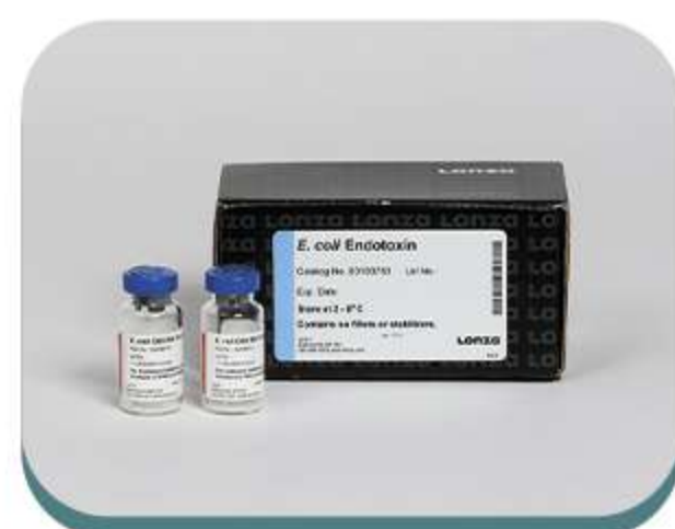
Equipamentos, kits e reagentes para detecção de endotoxinas