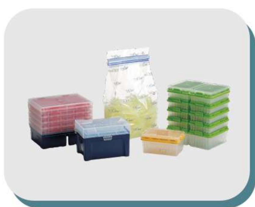
Ponteiras com e sem filtro, ponteiras de baixa retenção e racks

A USA Scientific é fabricante de plásticos de alta qualidade. Oferece equipamentos e acessórios confiáveis que ajudam pesquisadores a realizar o importante trabalho do laboratório.