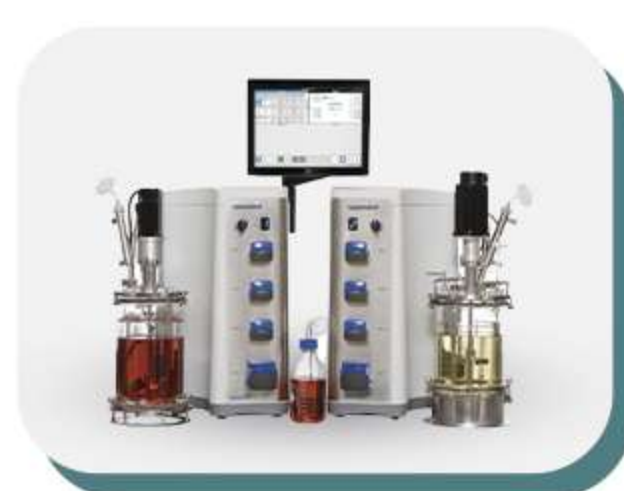
Equipamentos para bioprocessos