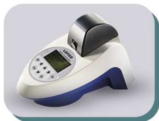
Luminômetro Lucetta 2